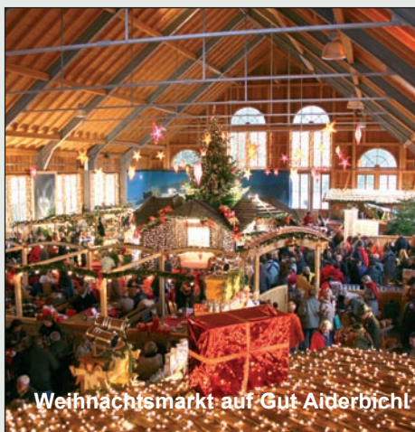
Weihnachtsmarkt auf Gut Aiderbichl