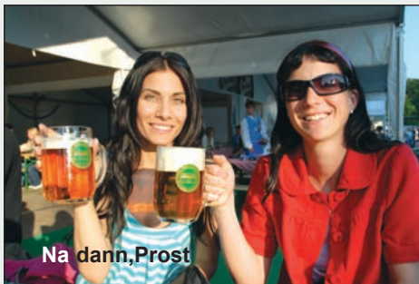
Na dann, Prost