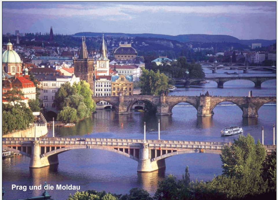
Prag und die Moldau

Prag, die Hauptstadt der tschechischen Republik. Die sanfte Hügellandschaft am Moldauknien bietet einen reizvollen Rahmen für das Zentrum von Prag. Dieses blieb weitgehend verschont von den Kriegen der jüngeren Geschichte und bietet eine gewachsene Vielfalt an Stilen europäischer Architektur. Eine erste große Glanzzeit erlebte Prag unter der Herrschaft von Karl IV. der 1355 zum Kaiser des Heiligen Römischen Reiches gewählt wurde. Die Karlsbrücke, die erste Universität Mitteleuropas und der Veitsdom sind herausragende Hinterlassenschaften dieser Zeit. Als augenfälliges Symbol wurden in dieser Zeit die Bleidächer vieler Türme vergoldet. Das Gold ist schon lange wieder runter, der Ruf von der "Goldenen Stadt" ist aber ungebrochen. Die Hauptgebiete mit den Sehenswürdigkeiten von Prag werden durch die Moldau getrennt. Am linken Ufer liegen die Prager Burg und die Kleinseite. Am rechten Ufer findet man die Altstadt, das jüdische Viertel und die Neustadt. Die wunderschöne Karlsbrücke überspannt die Moldau und verbindet die Altstadt mit der Kleinseite. Wir bieten Ihnen die Möglichkeit diese faszinierende Stadt für wenig Geld zu erleben.