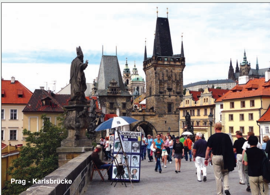
Prag - Karlsbrücke

Noch einmal gut frühstücken und schon geht es zurück in die Heimat.