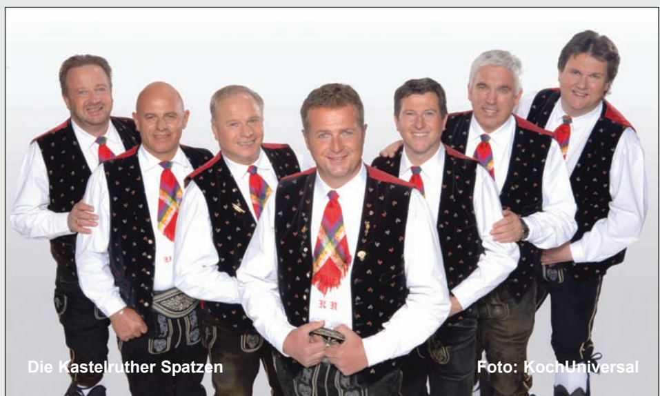
Die Kastelruther Spatzen

hat in diesem Ort Tradition. Zum 20. Mal ist deshalb Ellmau der Austragungsort des bekanntesten Volksmusikfestes im Alpenraum. Der Treffpunkt für alle Freunde der volkstümlichen Musik. Seit 20 Jahren lockt dieses Fest die grossen Stars der Volksmusik an. Viele tausend