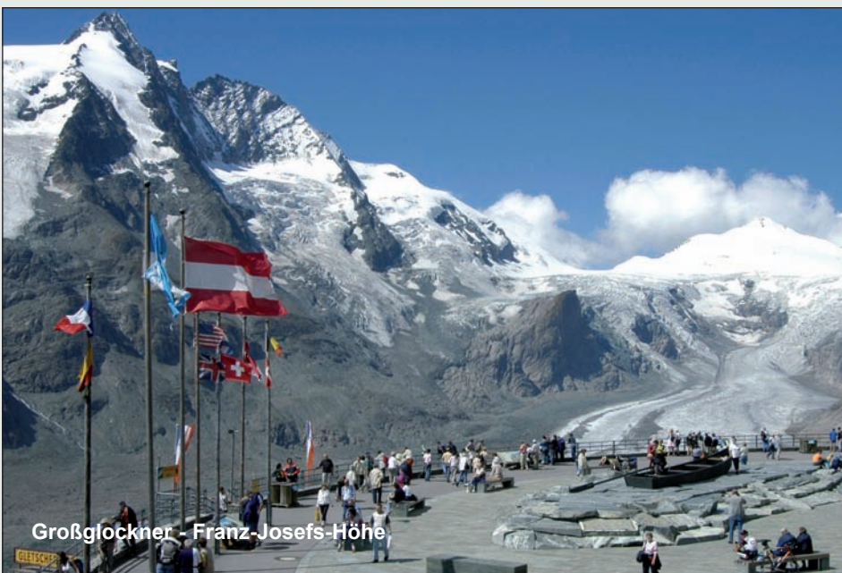
Großglockner - Franz-Josefs-Höhe

Nach der Fahrt über München, Salzburg und die Tauernautobahn erreichen Sie