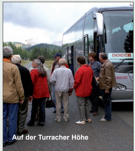
Auf der Turracher Höhe

Hochalpenstraße ist einzigartig. An blühenden Almwiesen vorbei und mächtigen Felsen erreichen Sie auf 2.369 m die Franz-Josefs-Höhe. Sie haben einen atemberaubenden Blick auf den größten österreichischen Gletscher und die Bergwelt der Glocknergruppe. Rückfahrt zum Hotel. Heute ist ein Grillabend angesagt und danach können Sie bei Musik das Tanzbein schwingen.