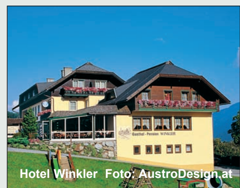
Hotel Winkler