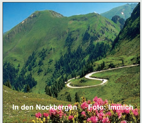
In den Nockbergen