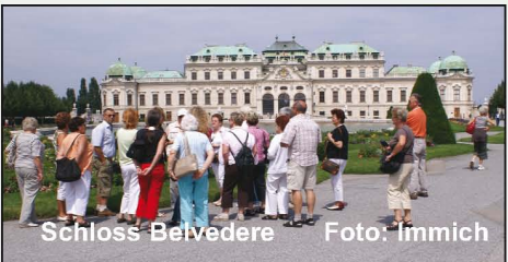
Schloss Belvedere

Zunächst wird heute Morgen erst einmal gut gefrühstückt. Wien, Wien nur du allein... Die Donaumetropole hat bis heute